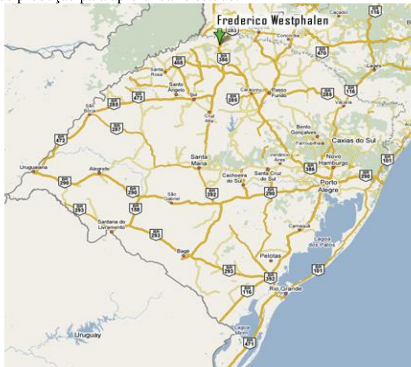
FIGURA 01: Localização do município de Frederico Westphalen/RS.

Conforme Gil (2002, p. 44) “a pesquisa bibliográfica é desenvolvida com base em material já elaborado, constituído principalmente de livros e artigos científicos, já a pesquisa documental vale-se de materiais que não recebem ainda um tratamento analítico, ou que ainda podem ser reelaborados de acordo com os objetivos da pesquisa”, onde serão utilizados dados das unidades de produção para aprofundar o estudo.