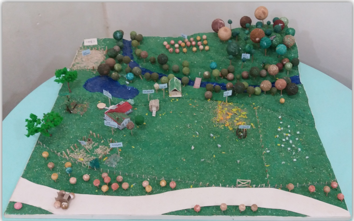
Fotografia 1 – Maquete propriedade rural sustentável

localização da casa foi planejada de modo a aproveitar a luz proveniente do período da manhã, sendo que a casa sustentável contou com telhado verde para melhor aproveitamento e retenção do calor e cisterna para reaproveitamento da água da chuva. Ainda, buscou-se mostrar a preservação da mata nativa na Zona 4, bem como a preservação das matas ciliares no rio e na estrada. As Fotografias 1, 2 e 3 apresentam a maquete elaborada.