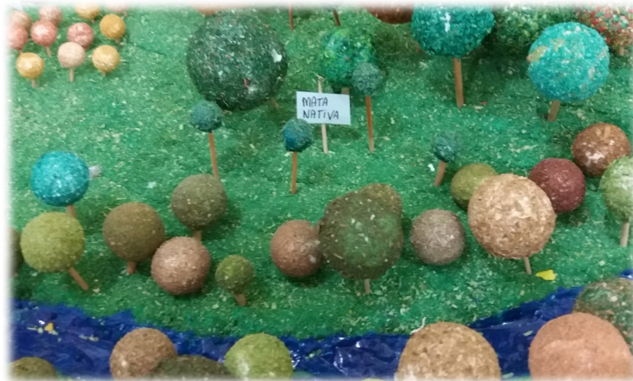
Fotografia 3 – Detalhe das Zonas 4 e 5