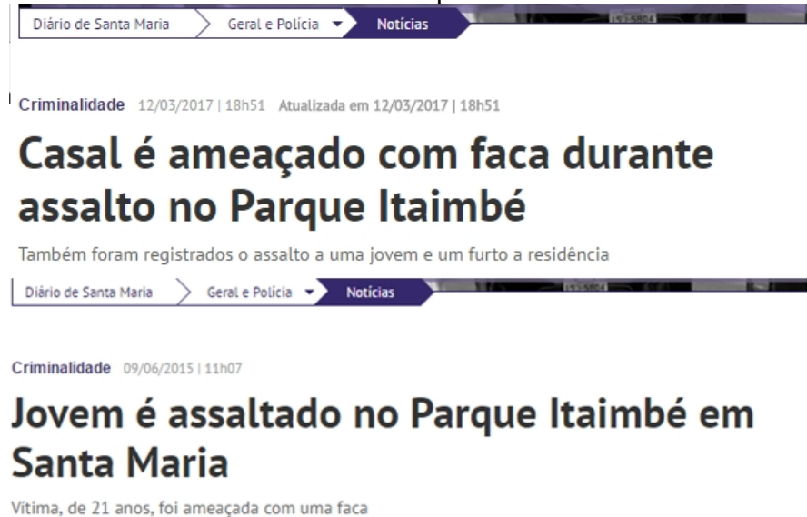
Imagem 3: Notícias vinculando furtos no Parque Itaimbé.